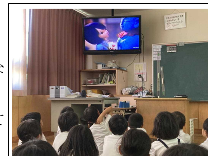
「おこり地蔵」を視聴する1・2年生